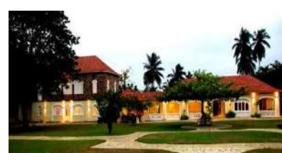
Principe: Roça Belo Monte 5*