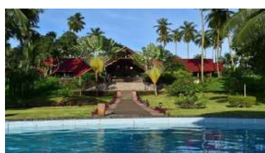
Rolas: Pestana Equador 4*