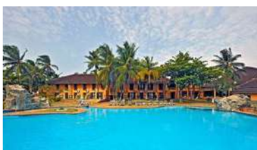
Sao Tome: Pestana S.Tomé 5*